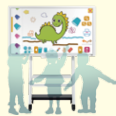
大画面タッチパネル「CoCoRo Map」で集団トレーニング