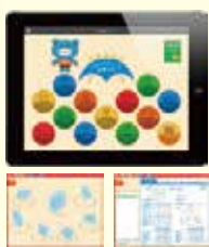
脳バランスサーキット