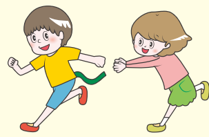
固有感覚／順番待ち／共同／共感／模倣能力／我慢